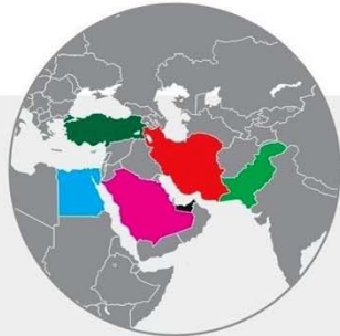
رتبه ایران و پنج کشور منطقه در شاخص‌های مختلف جهانی